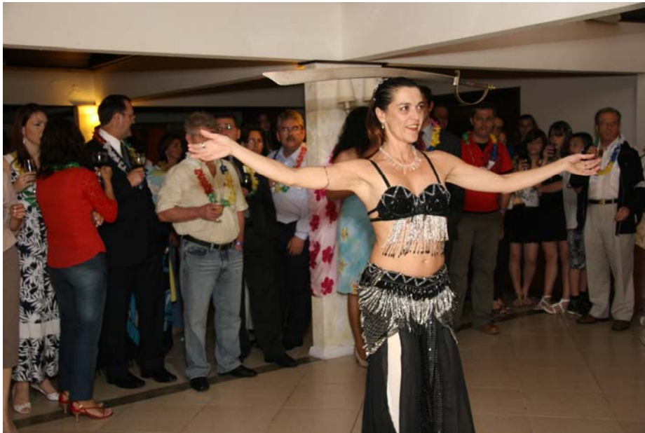
Apresentação de danças.