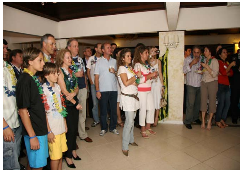
Apresentação de danças.