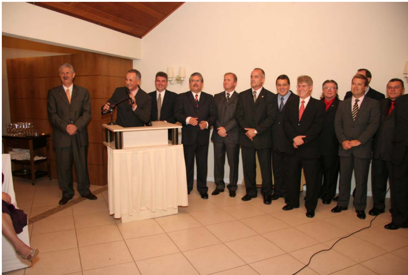
Diretores e Delegados Regionais do SEAC/SC e SINDESP/SC