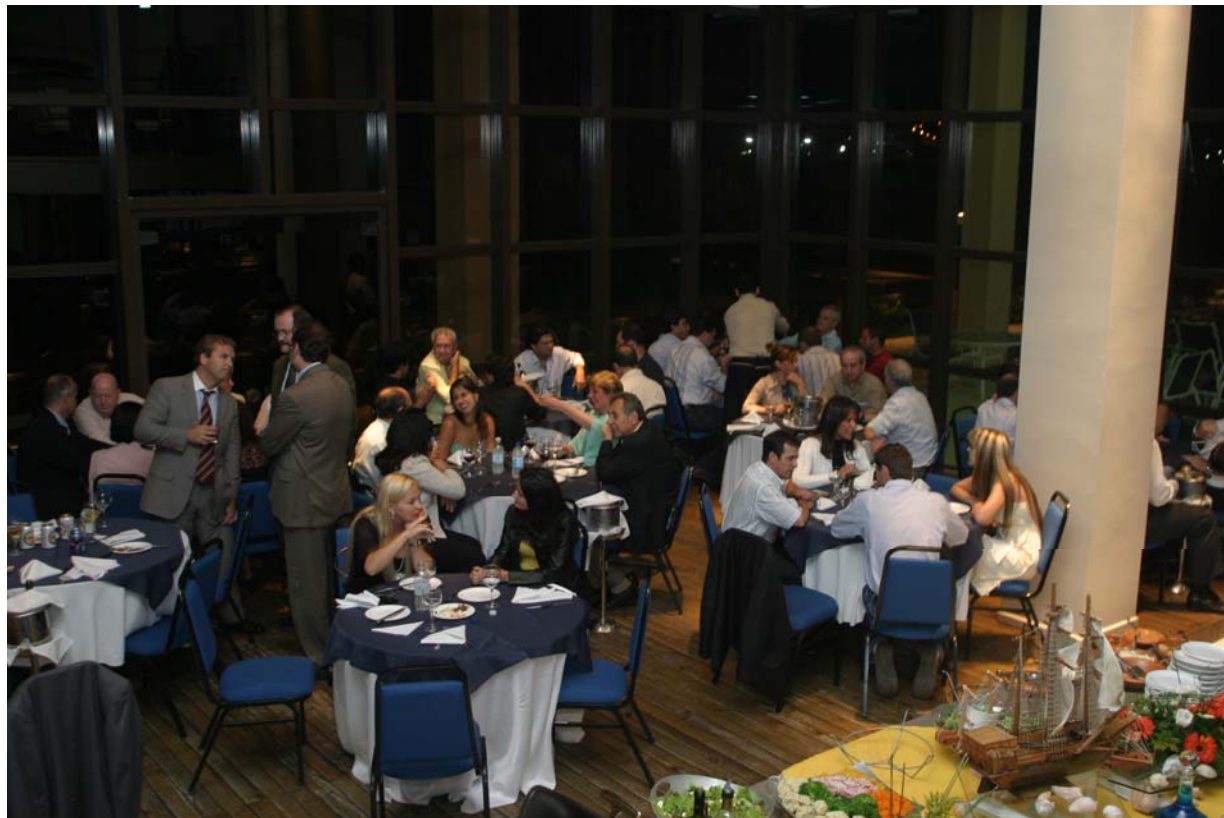
Jantar de encerramento do ENESP SUL, dia 10/11.