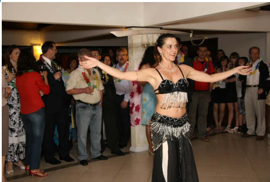
Apresentação de danças.